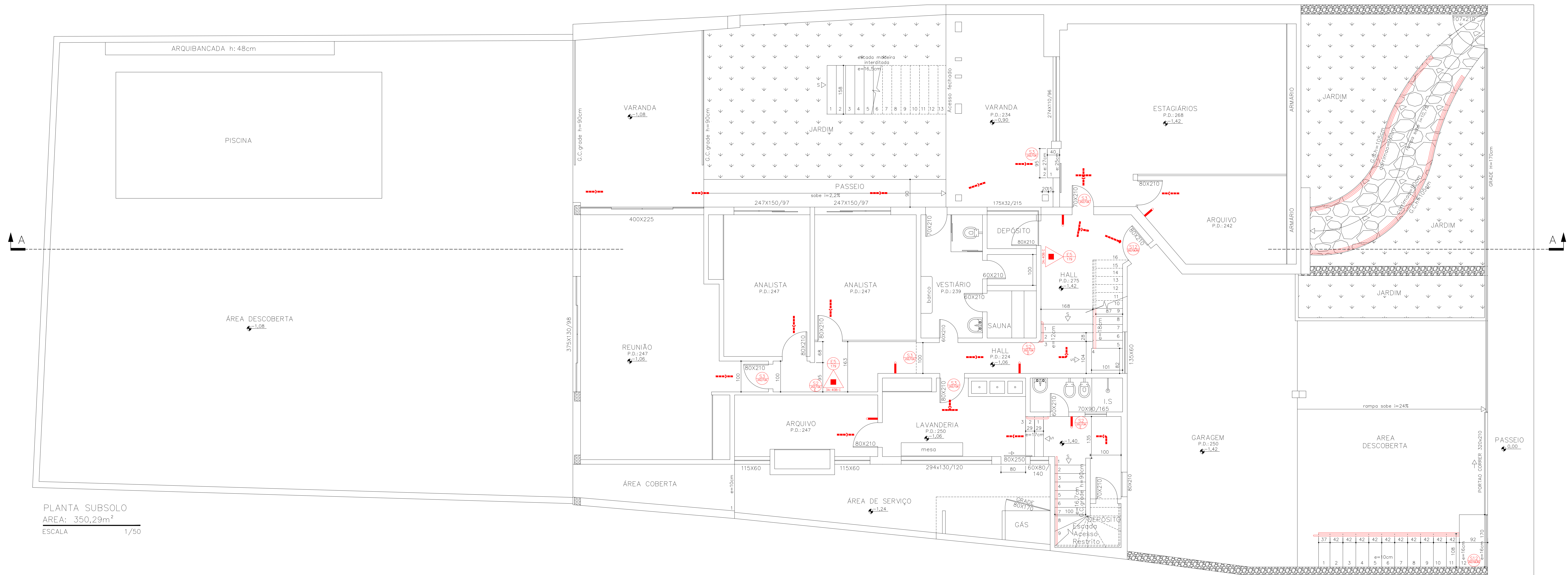
PLANTA SUBSOLO ÁREA: 350,29m 2 ESCALA 1/50